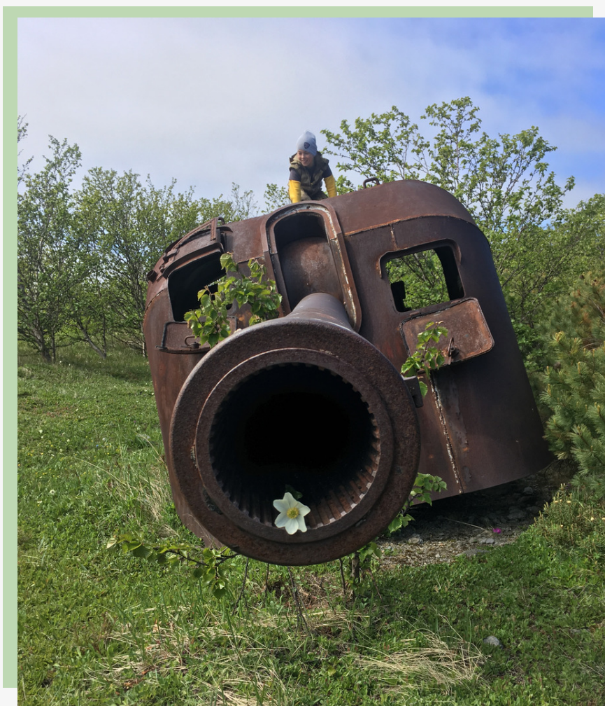
Рис. 23. Корабельное 130-мм орудие Б-13

В настоящее время на береговом хребте находятся 3 снятые с фундаментов орудия. Здесь же можно видеть остатки орудийных бастионов (рисунки 23-25).