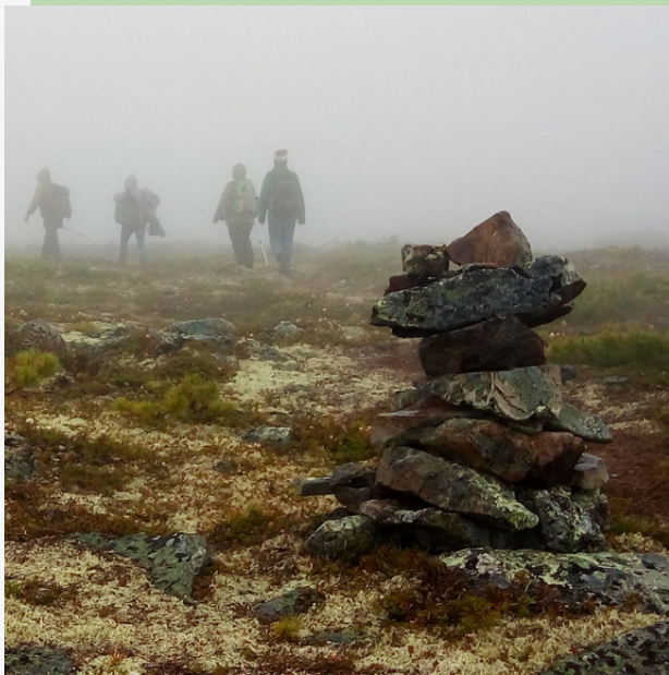
Рис. 7. Тур на безлесном участке в районе высшей точки маршрута