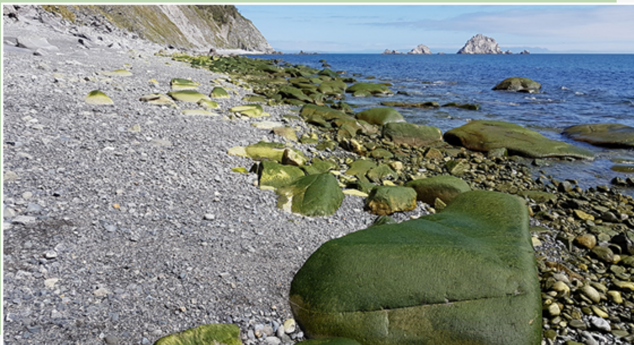
Рис. 15. Участок кольцевого маршрута «Бухта Батарейная» по морскому побережью от устья ручья Батарейный до мыса Восточный в период отлива. Не следует наступать на скользкие, покрытые мокрыми водорослями, камни.