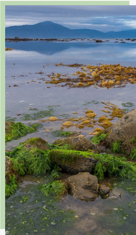
Рис. 19. Ламинария в полосе отлива

камни, морские звёзды и медузы дожидаются подъёма воды, в небольших лужицах суетятся мальки, "цветут" морские анемоны - актинии, таятся в своих раковинах крошечные раки - отшельники.