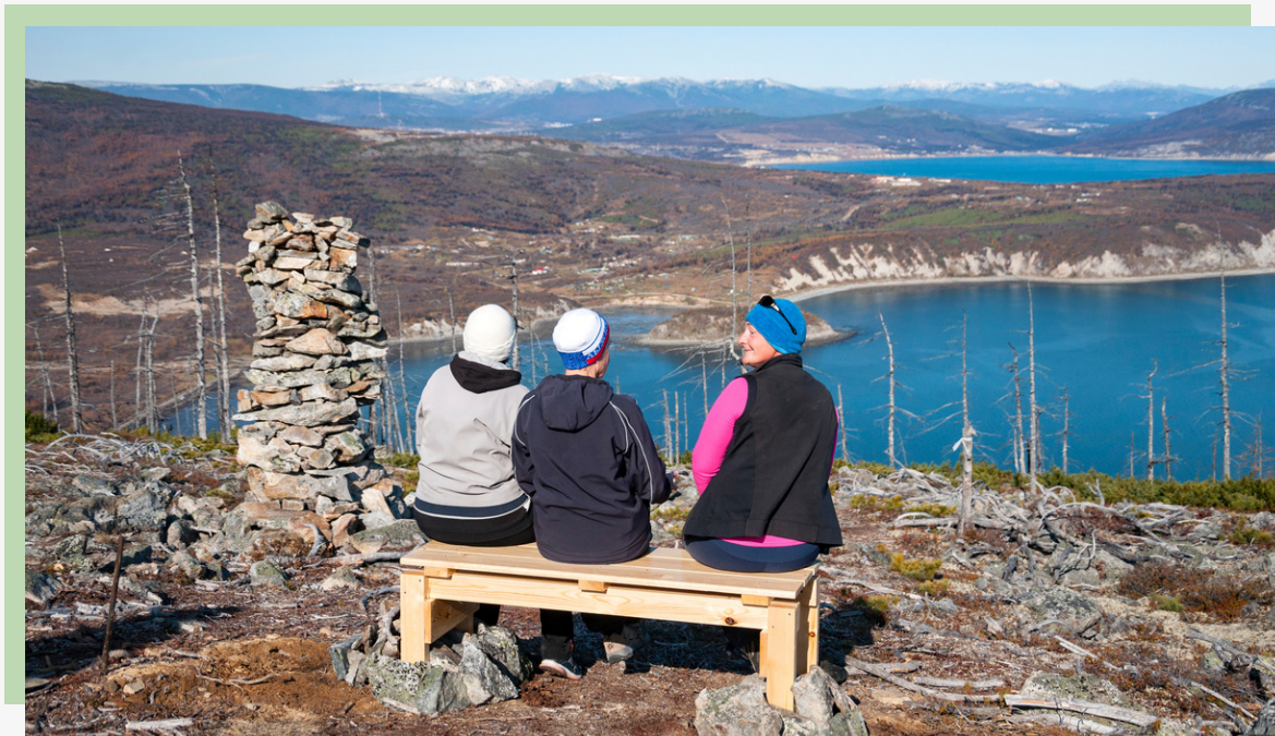
Рис. 20. Вид с обзорной точки на бухту Веселая

Большие каменные туры служат хорошим ориентиром для выхода на тропу даже в тумане (рис. 21).