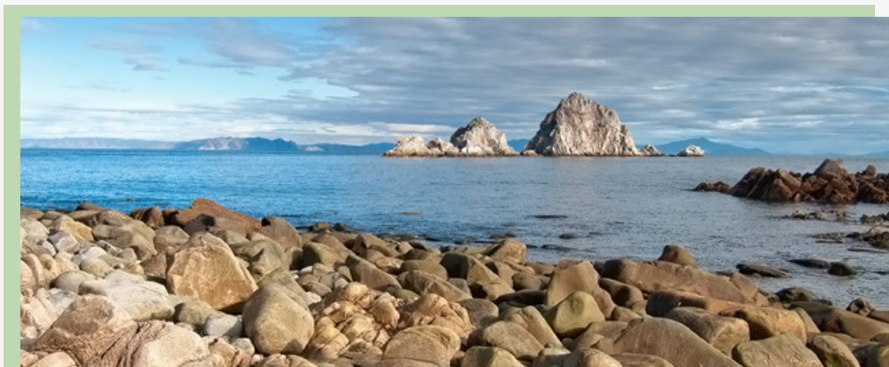
Рис. 16. Острова Три Брата

От точки старта тропа поднимается по склону сквозь лиственничный лес и заросли стланика, затем выходит на участки старого горельника, вьётся между упавших лиственничных стволов и переплетений ветвей погибшего в огне кедрача. На горельнике много брусники. Природа восстанавливается – склон покрыт мхами, молодыми лиственницами и кустарниками карликовой берёзки. С набором высоты встречаются всё более старые деревья, которых не коснулись ни топор, ни огонь. Многим из них больше сотни лет. На вершине растительности совсем мало. Кедровый, берёзовый, ольховый стланики прижимаются к земле, лиственницы низкорослы, их стволы закручены спиралью под воздействием зимних ветров.