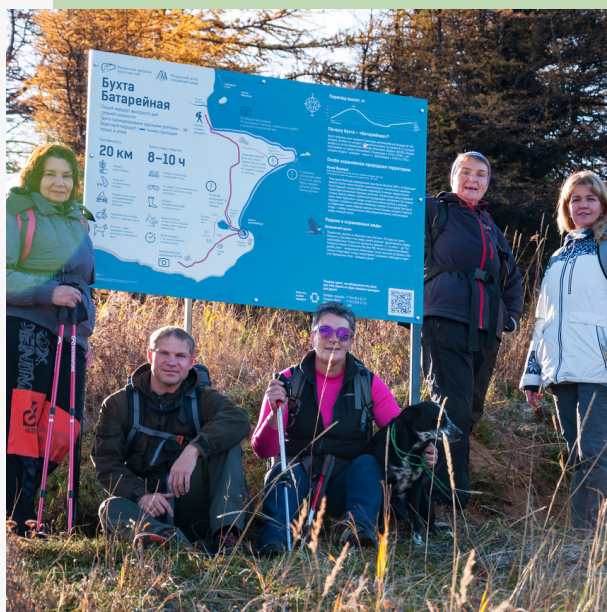
Рис. 12. Информационный стенд на старте маршрута