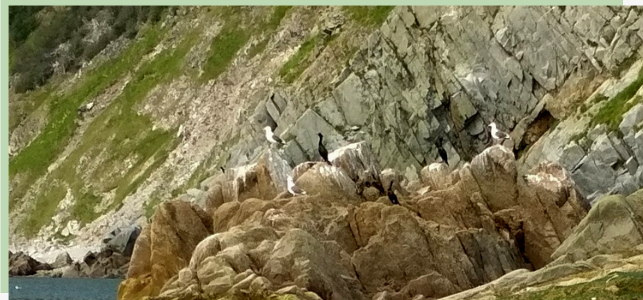
Рис. 18. Бакланы и тихоокеанские чайки на скалах у мыса Восточный

Несколько пар воронов, обитающих здесь круглый год, будут наблюдать за вами со скал, пока вы не покинете мыс, а после обязательно проверят, не осталось ли чего на месте вашего чаепития.