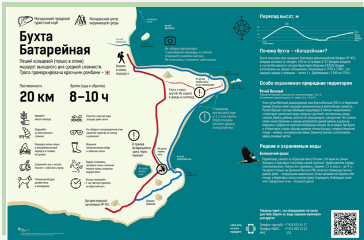
Рис. 11. Информационный стенд маршрута «Бухта Батарейная»

в точке старта и финиша находятся информационные стенды со схемой маршрута (рисунки 11 и 12); на тропе – стенд с правилами поведения в природе (рисунок 13).