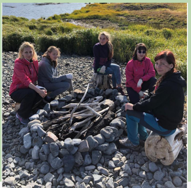
Рис. 10. Кострище в районе устья ручья Батарейный (бухта Батарейная)