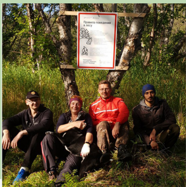
Рис. 13. Стенд с правилами поведения в природе на тропе в долине ручья Батарейный