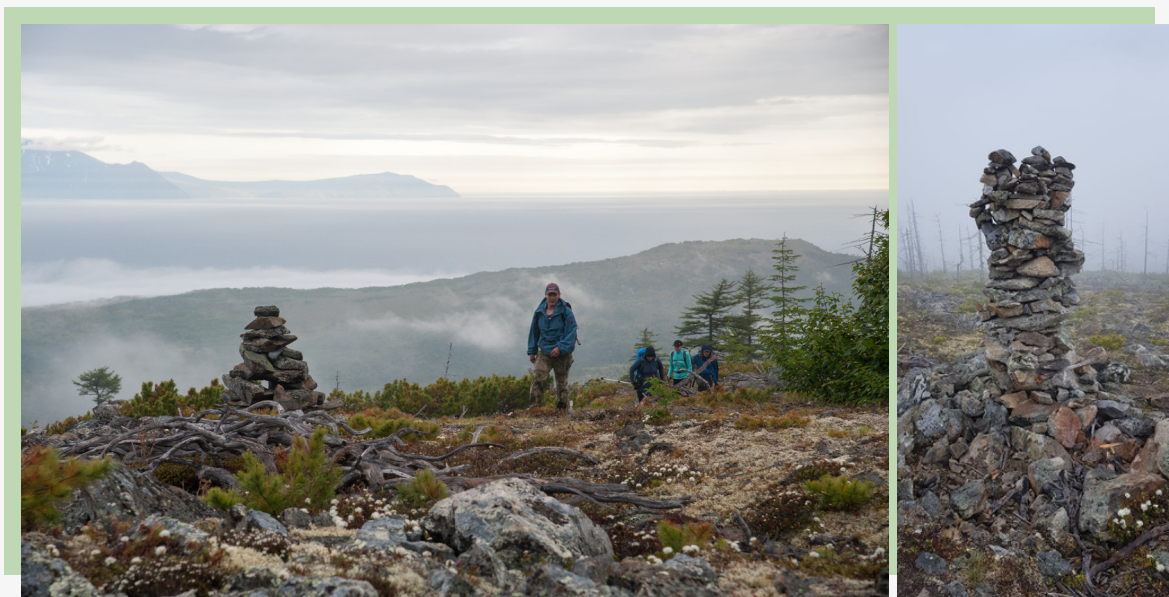
Рис. 21. Большие каменные туры - отличные ориентиры в тумане