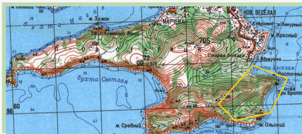
Рис.1. Расположение туристского маршрута выходного дня «Бухта Батарейная»