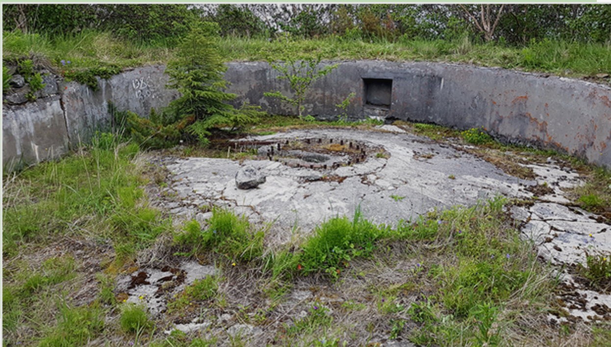
Рис. 24. Фундамент одного из орудий батареи