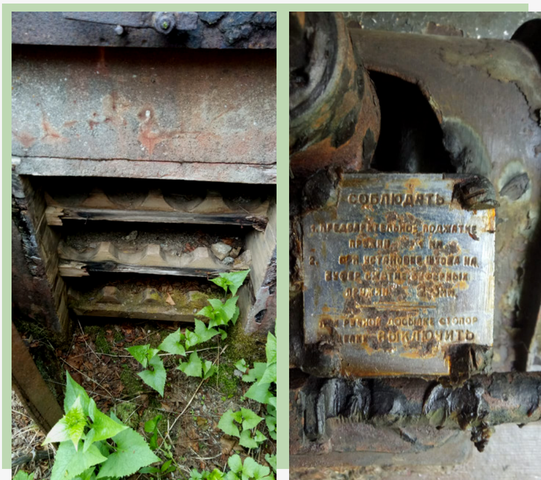
Рис. 25. Стеллаж для хранения зарядов, предупредительная табличка на корпусе орудия