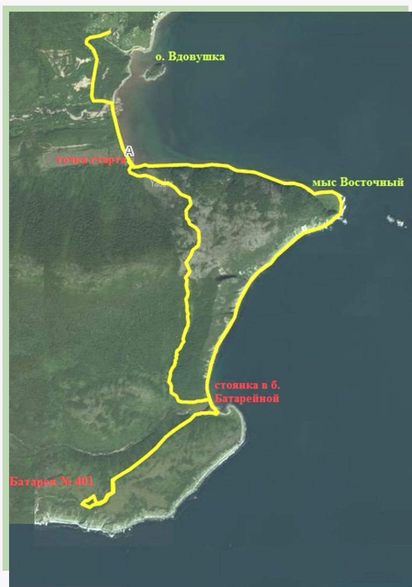
Рис. 2. Нитка туристского маршрута выходного дня «Бухта Батарейная», линейный и кольцевой варианты