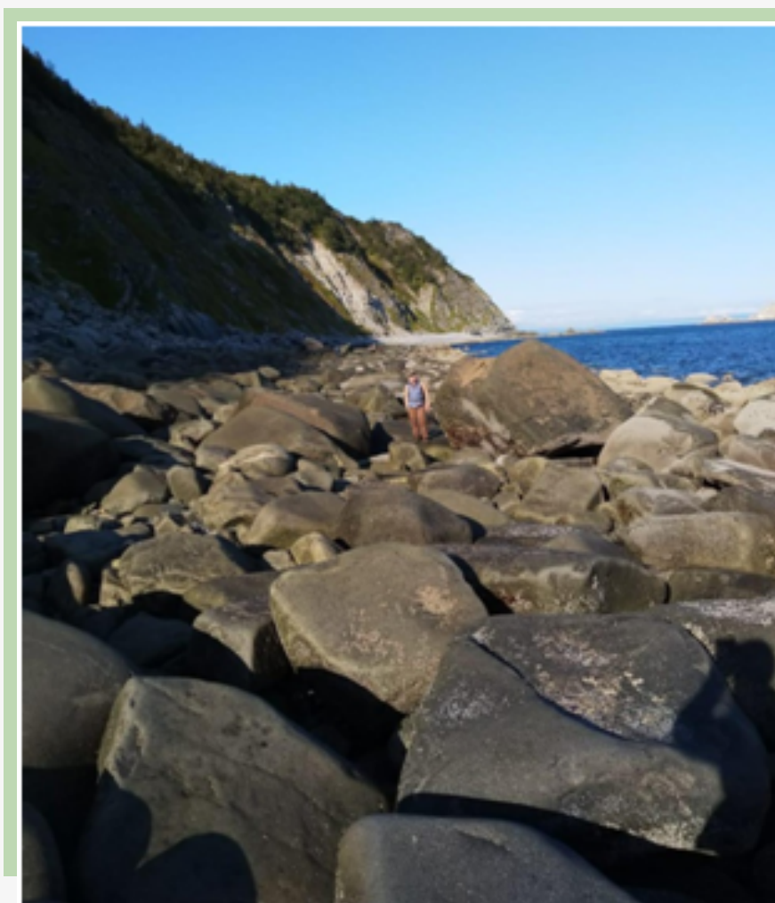
Рис. 14. Часть кольцевого маршрута «Бухта Батарейная» по морскому побережью проходит по крупным валунам

В случае прохождения кольцевого маршрута с движением по морской береговой полосе необходимо учитывать время приливов и отливов (высокая вода, малая вода). В полную воду прижим напротив Трёх Братьев непроходим.