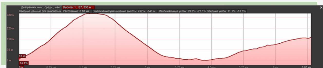
Рис. 3. Высотный график туристского маршрута выходного дня «Бухта Батарейная»