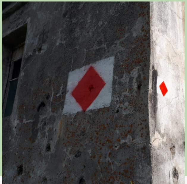
Рис. 8. Маркировка на разрушенном сооружении в долине ручья Батарейный у начала тропы к батарее орудий