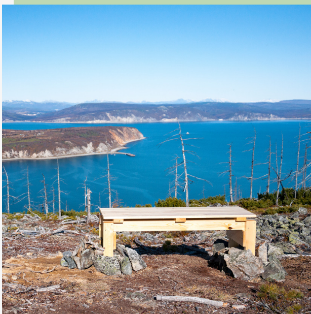
Рис. 9. Скамья для отдыха в панорамной точке (высшая точка маршрута). В бухте виден пирс для разгрузки взрывчатых веществ.

Места отдыха – скамейка, кострище. На аварийном выходе у мыса Восточный протянута веревка для облегчения подъема и спуска по крутому склону.