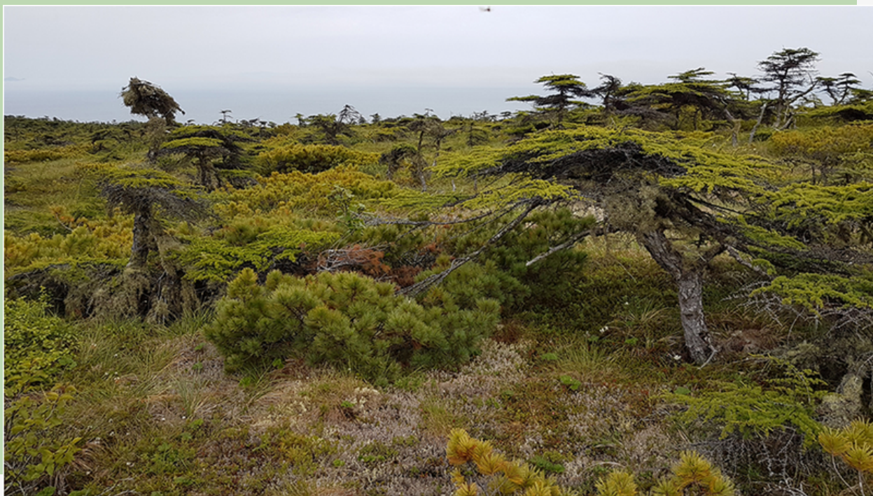
Рис. 17. Низкорослые лиственницы «флаговой» формы на лесотундровом плато

На лесотундровом плато в верхней части берегового хребта между долиной ручья Батарейный и остатками орудийной батареи расположен лиственничный лес, состоящий из низкорослых деревьев с кронами так называемой «флаговой» формы. Такую редкую форму (некоторые деревья напоминают японские бонсай) лиственницы приобрели под воздействием постоянных морских ветров на фоне низких температур и частых туманов (рисунок 17).