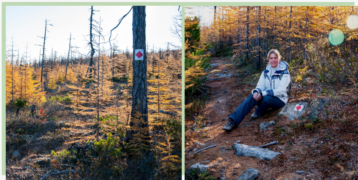
Рис. 5-6. Маркировка на тропе на склоне от точки старта до высшей точки маршрута

Марки нанесены на туры, камни и стволы деревьев, а также на пластиковые таблички, закреплённые на стволах и ветвях.