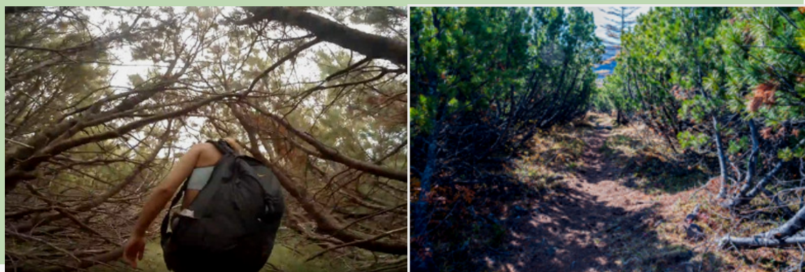
Рис. 22. Спуск к бухте Батарейная. Тропа до очистки (слева) и после (справа)

После перевала начинается спуск к бухте Батарейная. Тропа проходит по склону, густо поросшему кедровым стлаником. В настоящее время тропа расчищена силами городского турклуба и не представляет сложности для передвижения (рисунок 22).