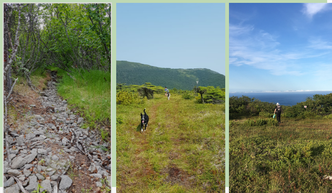
Рис.23. Тропа к батарее. Слева направо: подъём по "ольховой аллее", выход на плато к "флаговым" лиственницам, заросли ольхи и берёзки на подходе к батарее (справа виден знак маркировки)

Тропа к батарее орудий начинается из долины ручья Батарейный, проходит по узкой тропинке между заболоченной долиной ручья и разрушенным зданием бывшей войсковой бани (на стену нанесена маркировка, заметная издали), далее поднимается по заросшей ольховником автомобильной колее.