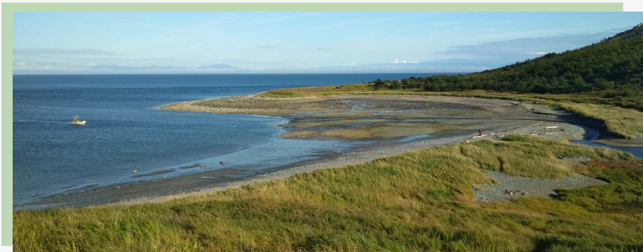
Рис. 27. Отлив в бухте Батарейной

наспех. находка стала поистине уникальной, ведь для коряков такой способ захоронения не был характерен, так как умерших они обычно кремировали. Найденные на островах предметы представлены в Магаданском краеведческом музее в экспозиции "Люди земли и моря".