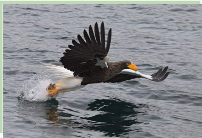
Рис. 18. Белоплечий орлан (морской орёл, орёл Стеллера)

Все гнёзда орланов картируются и занесены в реестр. За птицами ведётся наблюдение, специалисты стараются окольцевать и поставить на учёт каждую особь.